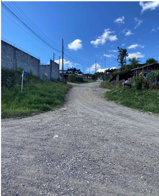
RUA ORLANDO FURISCHI