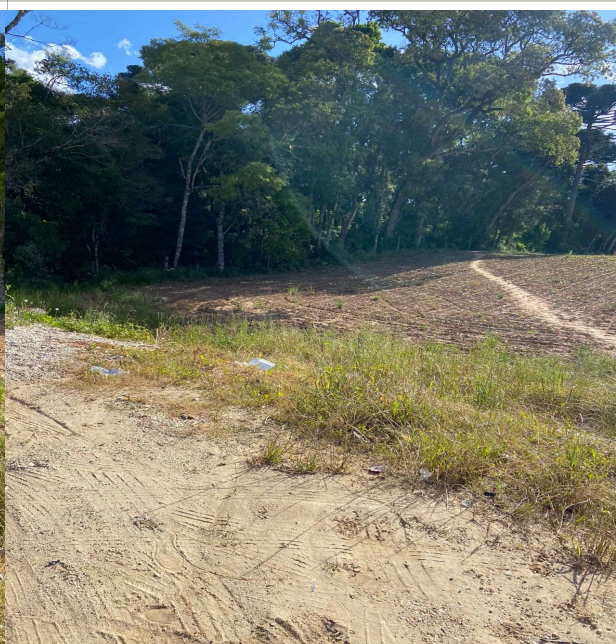
LOCAL DE EXECUÇÃO DE DA ALA PARA DESCARTE DAS ÁGUAS PLUVIAIS DA RUA JOSÉ DORIVAL VALTER E GILBERTO STRASBACH