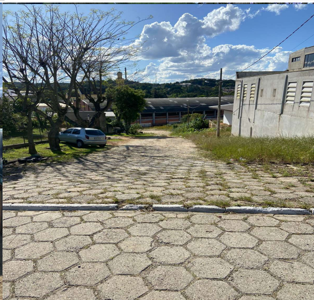
AVENIDA ESTEFANO GRABOSKI