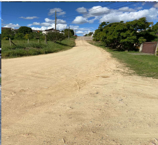
RUA 14 DE NOVEMBRO