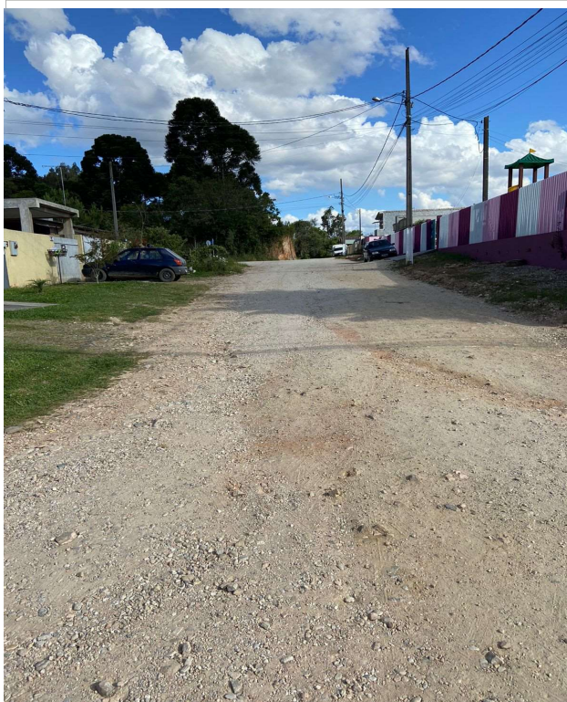
RUA GILBERTO STRASBACH