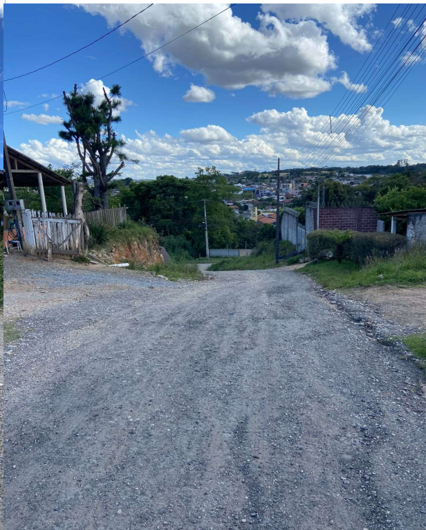
RUA ORLANDO FURISCHI