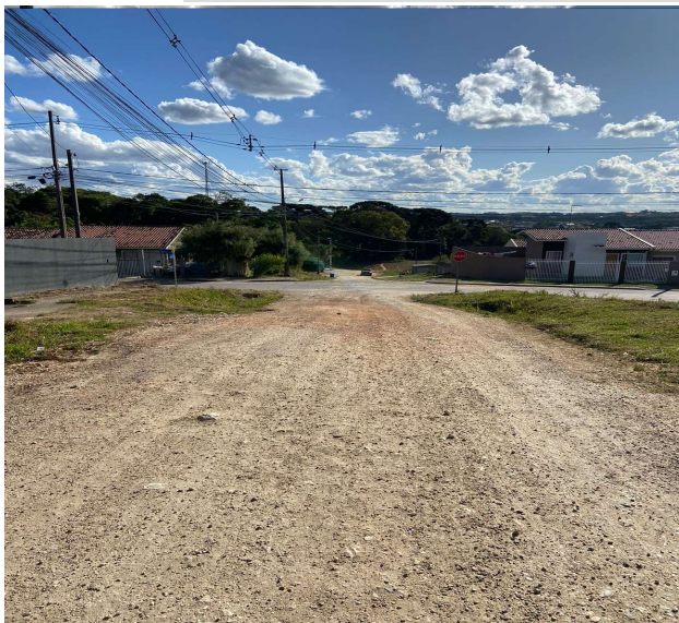
RUA JOSÉ DORIVAL VALTER