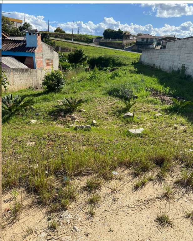
LOCAL DE EXECUÇÃO DA ALA DE DESCARTE DAS ÁGUA PLUVIAIS DA RUA 14 DE NOVEMBRO