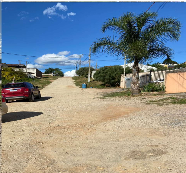
RUA JOSÉ DORIVAL VALTER - NESTE TRECHO APENAS SERÁ EXECUTADA A TUBULAÇÃO PARA DIRECIONAMENTO DAS ÁGUAS PLUVIAIS