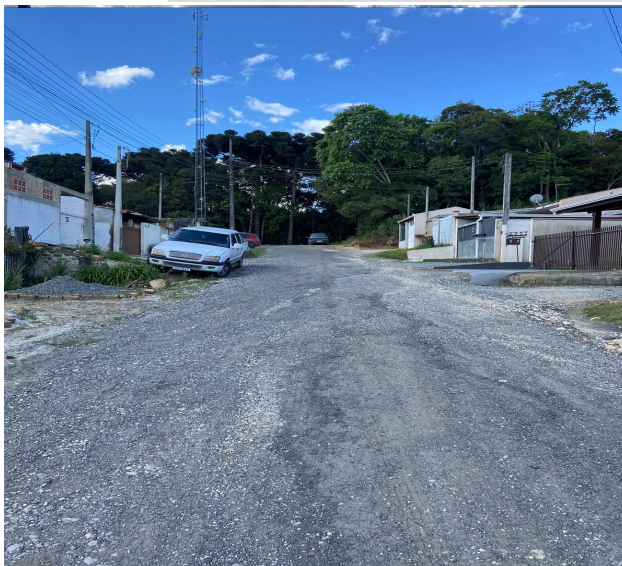
RUA ORLANDO FURISCHI