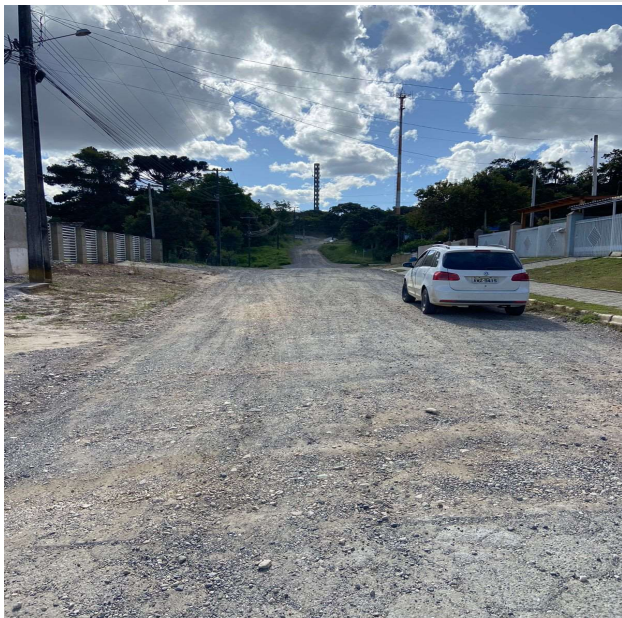
RUA MATIAS CORDEIRO SOARES