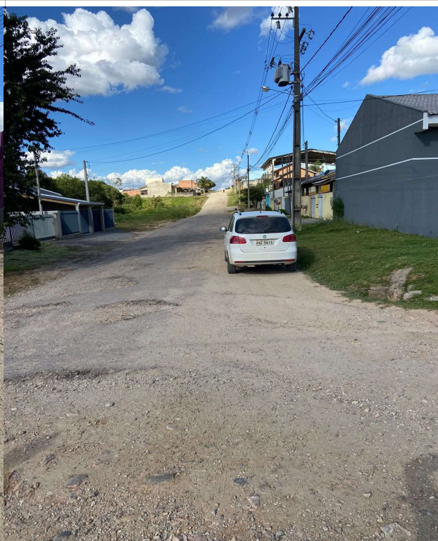
RUA JOSÉ DORIVAL VALTER